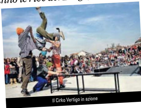
Il Cirko Vertigo in azione

I vari artisti saranno divisi in due gruppi principali, ossia 'In' e 'Off'. «La differenza - spiega Masha Dimitri - è che gli artisti del gruppo 'In' verranno votati dal pubblico, che sarà la giuria di tutto il Festival, e lo spettacolo vincitore si aggiudicherà un premio. Rispetto agli anni passati abbiamo voluto togliere il lato competitivo della rassegna, ma abbiamo mantenuto il 'Premio del pubblico' per aumentare ancor più il coinvolgimento fra gli spettatori e l'artista». Alla fine della loro esibizione gli artisti del gruppo 'In' potranno sfoderare il 'cappello', ossia potranno chiedere un'offerta agli spettatori che dimostrer-