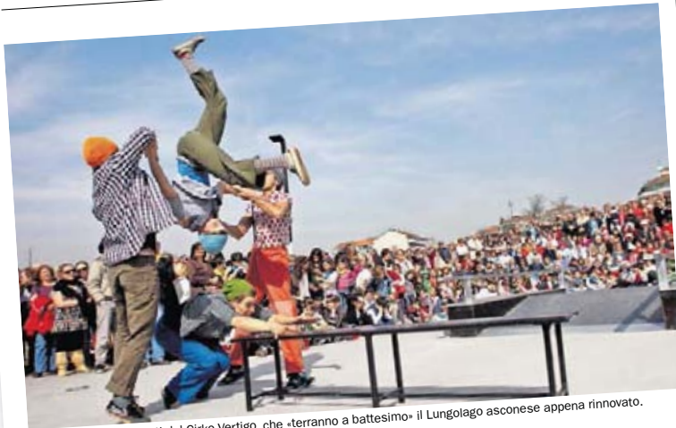
SPERICOLATI Gli artisti del Cirko Vertigo, che «terrano a battesimo» il Lungolago asconese appena rinnovato.